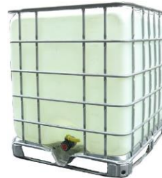
Sampla de IBC

ar fáil freisin i gcumais níos lú. Moltar freisin an IBC a líonadh go dtí an barr le huisce chun gluaiseacht leachtach a sheachaint, mar a tharlódh mura mbeadh sé ach lán go páirteach.