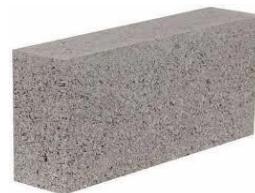
100 x 220 x 450 mm bloc tógála coincréite soladach

Ní mór an leantóir a chur i láthair don tástáil le fóirmhais iomlán 800 kg ar a laghad, agus aird chuí á tabhairt ar shábháilteacht, cobhsaíocht, treoirilínte an mhonaróra agus teorainneacha dlíthiúla an chomhcheangail.